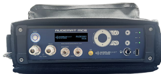
Imagen: Audemat MC6 en su estuche

Ya reconocido como una de las soluciones más completas del mercado para el análisis de señales FM y DAB+, el Audemat MC6 v1.3 va aún más lejos al incorporar: