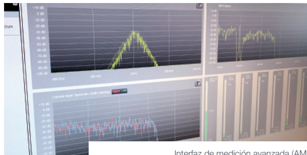
Interfaz de medición avanzada (AMI)