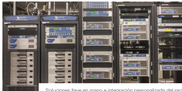
Soluciones llave en mano e integración personalizada del rack