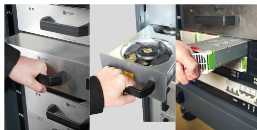
Fuentes de alimentación, amplificadores de potencia y ventiladores redundantes e intercambiables "en caliente"