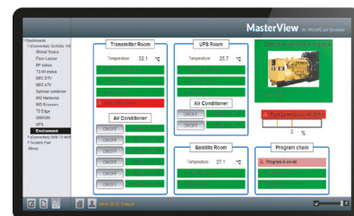
MasterView-Vistas personalizadas remotas

Con MasterView puede mostrar datos y controlar equipos en múltiples vistas personalizadas. Cada vista puede contener tanta información del sitio remoto como se desee. MasterView también está disponible como una aplicación web. Las vistas se crean con un navegador web estándar y se visualizan desde cualquier PC o dispositivo móvil.