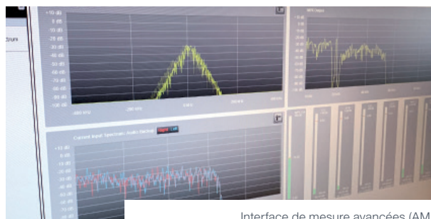
Interface de mesure avancées (AMI)