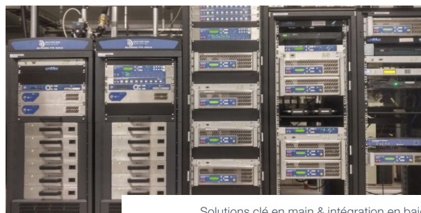
Solutions clé en main & intégration en baie