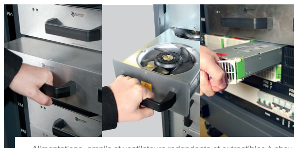
Alimentations, amplis et ventilateurs redondants et extractibles à chaud