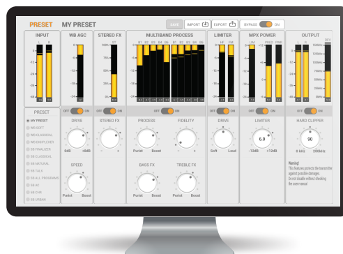
Interface de traitement de son