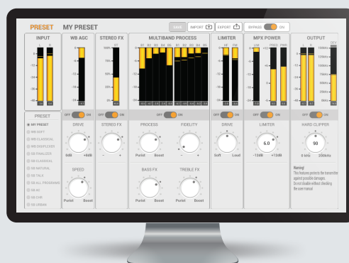
Interface de traitement de son