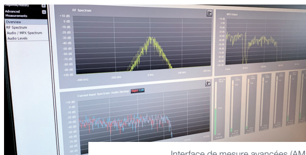
Interface de mesure avancées (AMI)