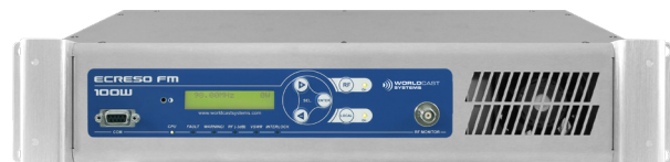
Egreso FM 100W