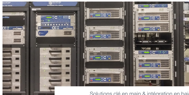
Solutions clé en main & intégration en baie