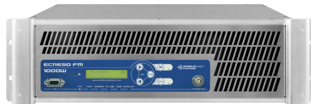
Egreso FM 1000W